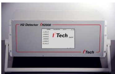
I 3 Tech - Formiergas-Sensor

I3H2000 integrierte redundante Wasserstoffsensoren verkürzt den Prüfzyklus von bisher branchenüblichen mehreren Minuten auf nur noch Sekunden.